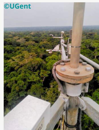
FloxBox installée sur la tour

Une session de présentation a également permis aux chercheurs de l'Université de Gand (UGent) de partager leurs travaux avec l'équipe Congoflux et des étudiants en master, renforçant ainsi les synergies entre les aspects techniques et l'analyse des données.