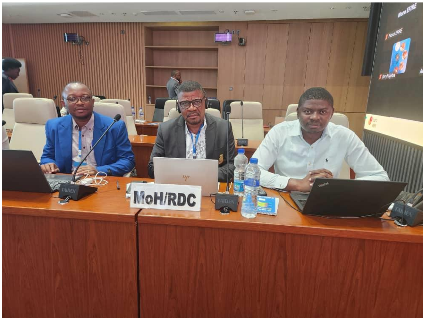
Participation de la RDC a la revue intra-action continentale de la riposte Mpox en Afrique, Africa CDC, Addis-Abeba, Dec. 16-18, 2024