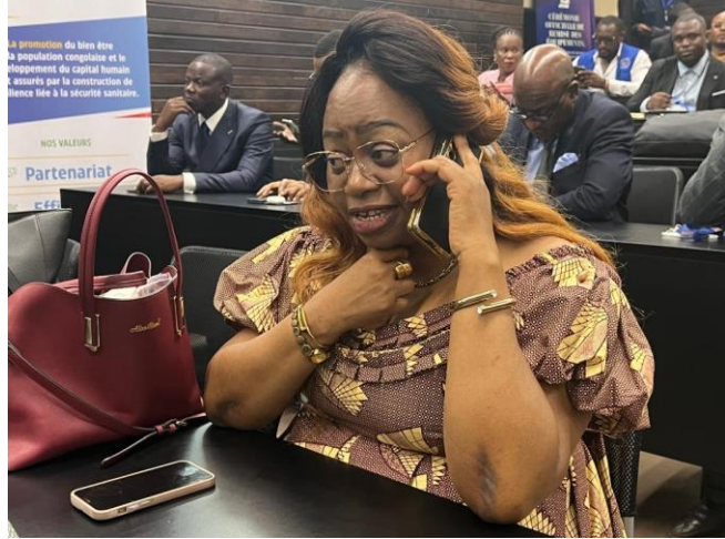
Cérémonie de remise des matériels de laboratoire a’ l’INRB par SEM le Président de la République avec participation active de l’INSP, le COUSP et le SGI Mpox et appui de Africa CDC