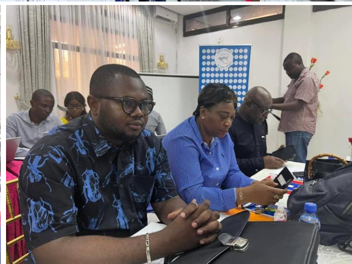
Travaux de la revue intra-action de la réponse Mpox en RDC