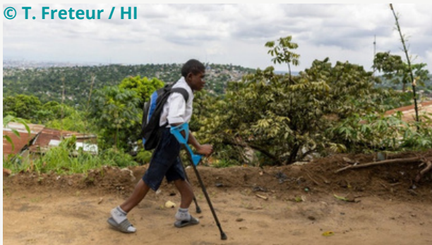
Un enfant bénéficiaire sur le chemin de l'école inclusive de Selembao à Kinshasa

« Ensemble, pour le développement harmonieux de nos enfants » est le programme 2022-2026 mis en œuvre par HI sous financement de la DGD. Ce programme vise à favoriser le développement des enfants de 0 à 12 ans, avec une attention particulière aux enfants handicapés ou à risque de retard de développement, dans 4 zones de santé de Kinshasa (Bumbu, Selembao, Ngiri Ngiri, Mont Ngafula) en améliorant leur accès à des services de santé (dont la réadaptation), des services sociaux et des services éducatifs inclusifs de proximité et en assurant un environnement familial et communautaire sûr et protecteur.