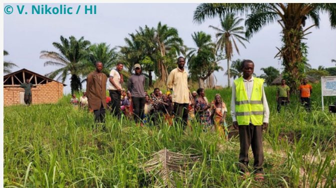
Des bénéficiaires de la relance agricole à Dibaya/Kasai en septembre 2022